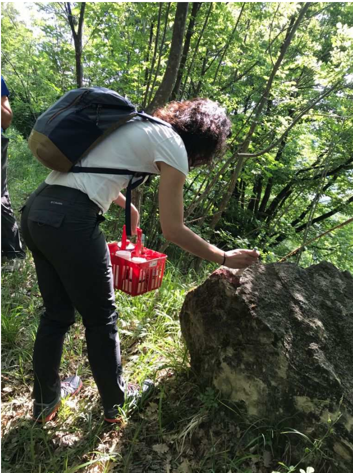
Richiami a pittura su pietra