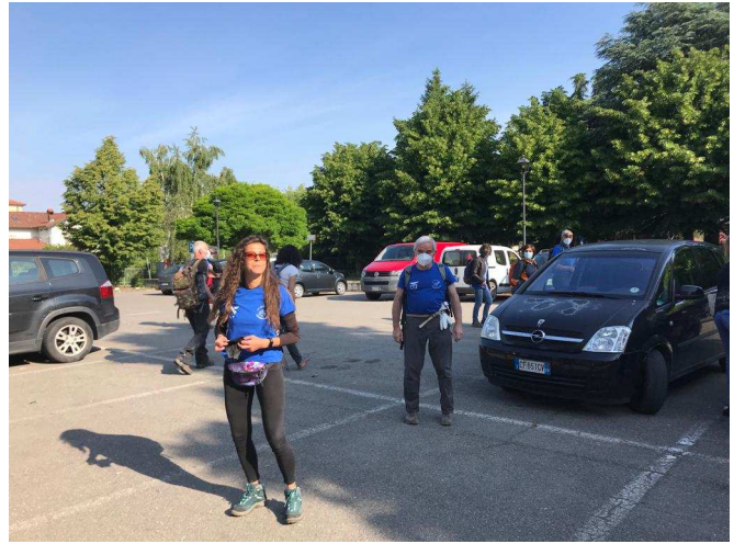
Preparativi per la partenza dal piazzale di Vignole Borbera