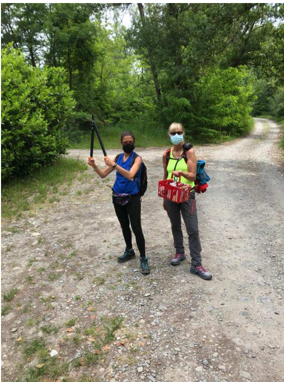
Il rientro con gli attrezzi usati per la pulizia e la segnatura.