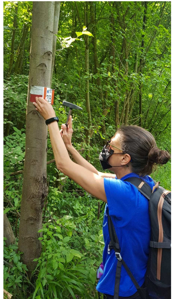
Segni a pittura di continuità e fissaggio bandierina con numero sentiero.