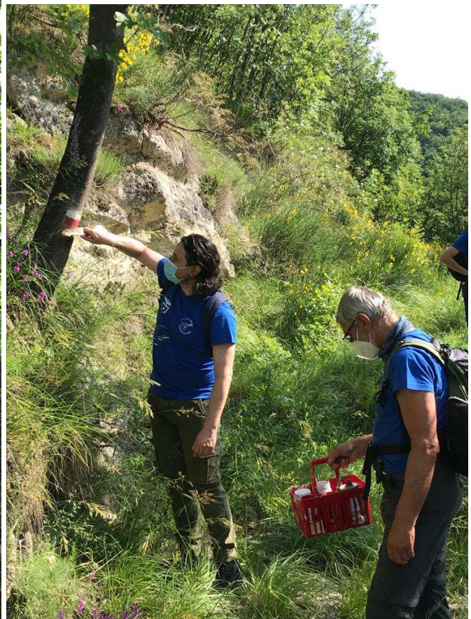
Pulizia prima della pittura