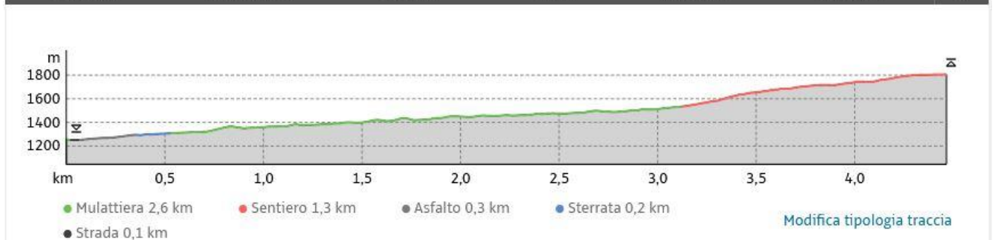
il percorso del Gruppo "base"